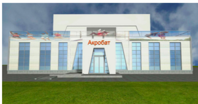
Вариант 5 фасада

«ФОК - это мечта четырнадцатилетней давности. В планах ещё есть гостиница для педагогов, поскольку для педагогов очень важно жильё. В настоящий момент мы испытываем трудности с помещениями для проведения разного рода мероприятий, особенно массового масштаба. Мы уже не умещаемся в актовом зале. У нас очень много видов деятельности, которые предполагают разного рода занятия - это и балльные танцы, и хореографические занятия, и спортивные акции, танцы, театр и так